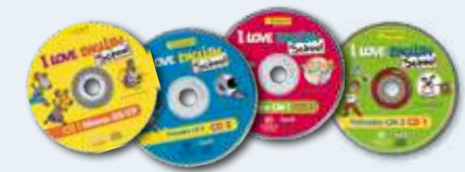
2 CD audio par niveau