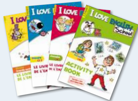
1 livre de l'enseignant