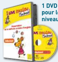
1 DVD pour le niveau débutant