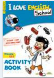
1 Activity Book corrigé pour chaque niveau (excepté pour le niveau débutant)