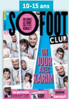
So Foot Club